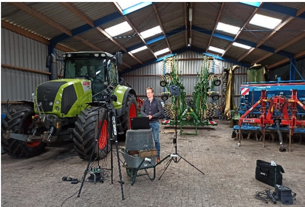
Foto: Opnames voor de e-learning cursus van Boer bij Kennis.

ondernemers, boeren en andere grondgebruikers te brengen.